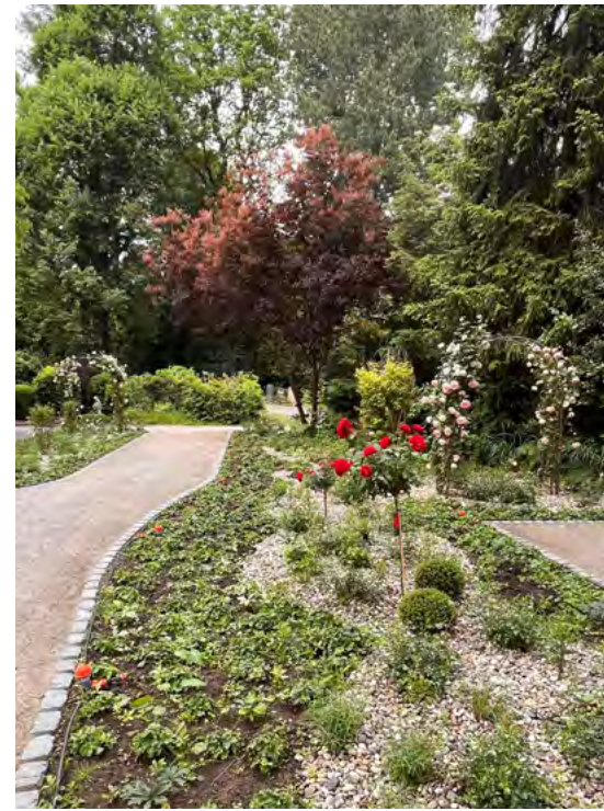
Der Themenbereich „Rosengarten“ ist besonders beliebt.